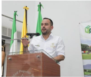
Ministerio de Minas y Energía

Regular y ajustar el esquema del cargo por confiabilidad disminuye el peso que este “seguro” representa en los costos de energía para los colombianos.