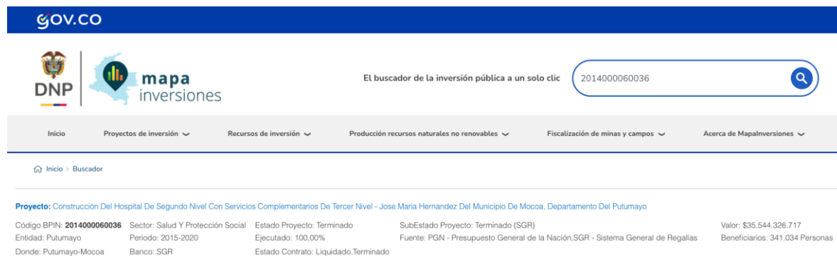
Imagen Nro. 2. "MapaInversiones"