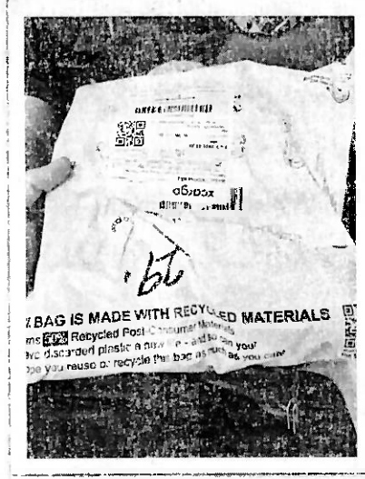
Buzón Shein, Titiribí, Antioquia