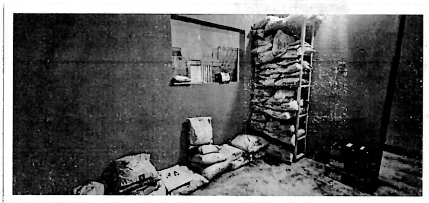
Buzón plataformas digitales, Andes, Antioquia.

Proyecto de ley número 466 de 2025 cámara "Por medio de la cual se modifica el valor para la exención del impuesto sobre las ventas (IVA) a la importación de productos bajo la modalidad de tráfico postal y envíos urgentes, se modifica parcialmente el estatuto tributario y se dictan otras disposiciones."