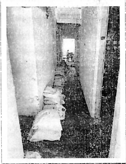
Buzón Shein, Titiribí, Antioquia

Proyecto de ley número 466 de 2025 cámara "Por medio de la cual se modifica el valor para la exención del impuesto sobre las ventas (IVA) a la importación de productos bajo la modalidad de tráfico postal y envíos urgentes, se modifica parcialmente el estatuto tributario y se dictan otras disposiciones."