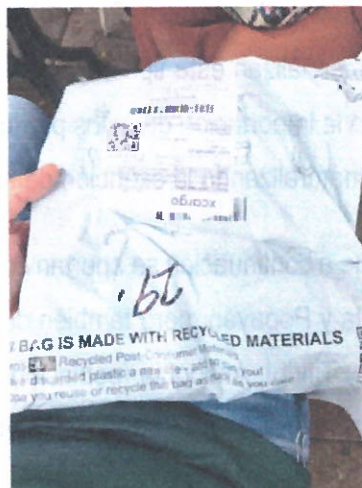
Buzón Shein, Titiribí, Antioquia