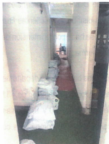
Buzón Shein, Titiribí, Antioquia