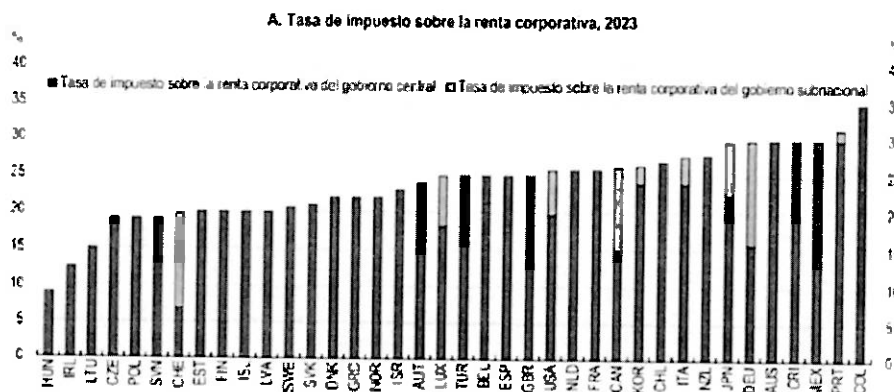
Gráfico 2.15. Las corporaciones enfrentan una alta carga fiscal, desigualdades horizontales y un código tributario complejo

impuesto al dividendo del inversionista extranjero del 20% al 30%. Si se combinan ambos gravámenes —renta en la sociedad y dividendo al inversionista— la carga salta del 48% vigente al 54,5%, y en sectores con sobretasas llega hasta 65%. La tabla de combinaciones del propio insumo técnico lo muestra en frío: con utilidad de 100, renta de 35, dividendo de 20% a 30%, el ingreso neto del accionista cae de 52 a 45,5 y la tributación total sube de 48,0 a 54,5; con sobretasas de 40%–50% y dividendo de 20%–30%, la combinación alcanza 65,0.