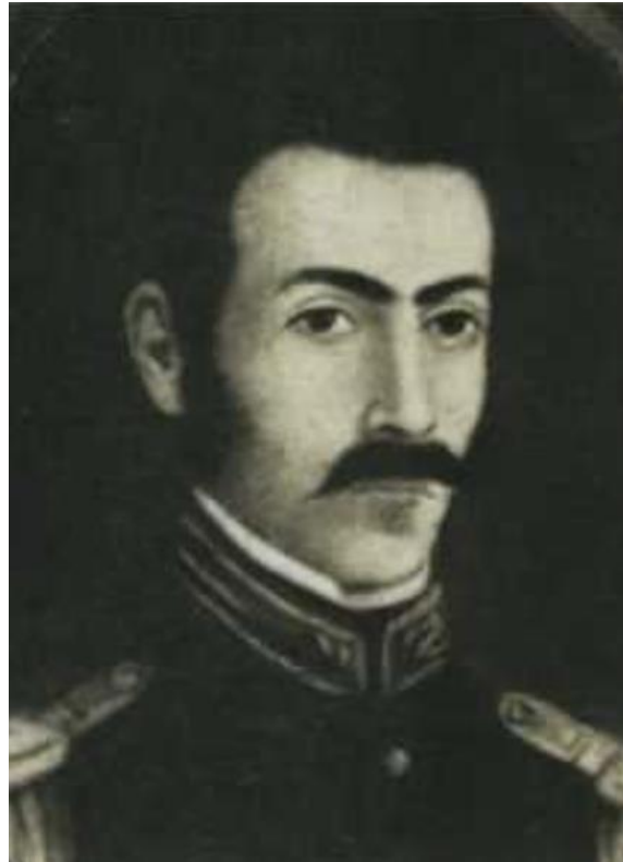
Juan Nepomuceno Moreno

Aunque la historia del departamento de Casanare y la ciudad de Pore no es muy difundida, son dos pilares fundamentales en la independencia, con el acuerdo del gobierno provisional se organizaron las bases de la nueva república, mientras que en otras regiones del país se combatía con el ejercito realista.