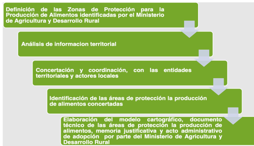
Figura 1. Proceso Metodológico General para la identificación de áreas de protección para la producción de alimentos en Colombia

La UPRA resume este procedimiento, que ha sido usado hasta el momento para las declaratorias de las ZPPA y posteriormente APPA, en la siguiente figura 8 :