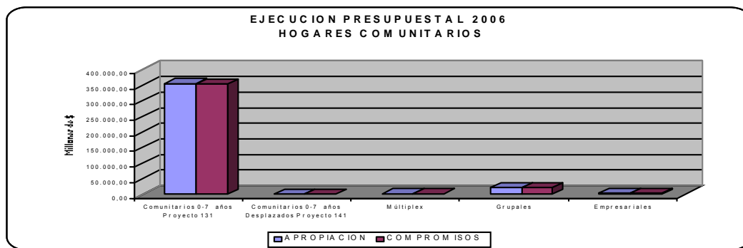
Gráfica No 1

Del programa Hogares Comunitarios de Bienestar, las modalidades que ejecutaron mayores recursos fueron: Hogares Comunitarios de Bienestar 0-7 (Tradicional) y Hogares Comunitarios Grupales.