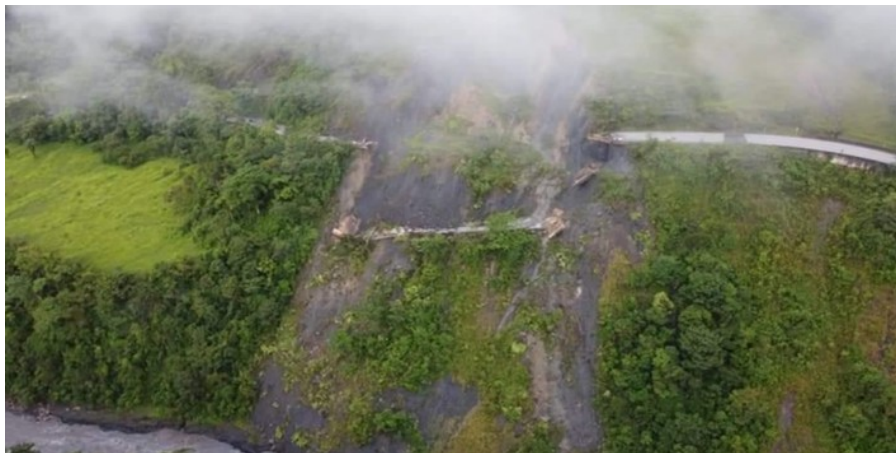
Primera emergencia PR 87+000 – Sector La Granja (01/11/2021).

Dadas las condiciones geotécnicas y de fuertes precipitaciones, en el PR 87+000 – Sector “La Granja”, el pasado 01 de noviembre de 2021 se produjo la pérdida de la banca en una longitud aproximada de 100 metros lineales. En la siguiente imagen se ilustra la emergencia.