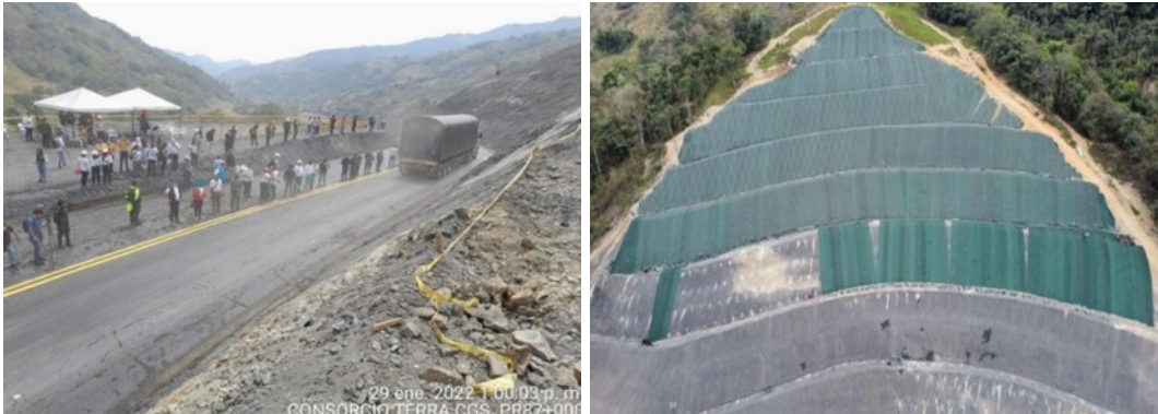
Restablecimiento de movilidad PR 87+000 – Sector La Granja (29/01/2022), Fuente: Consorcio Terra CGS

Luego de la puesta en servicio del corredor, el 25 de abril de 2022, se presentó una segunda emergencia, generada por una pérdida banca en una longitud aproximada de 30 metros lineales.