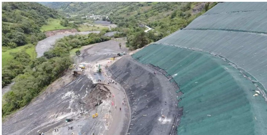
Segunda emergencia PR 87+000 – Sector La Granja (25/04/2022).

Luego de la puesta en servicio del corredor, el 25 de abril de 2022, se presentó una segunda emergencia, generada por una pérdida banca en una longitud aproximada de 30 metros lineales.