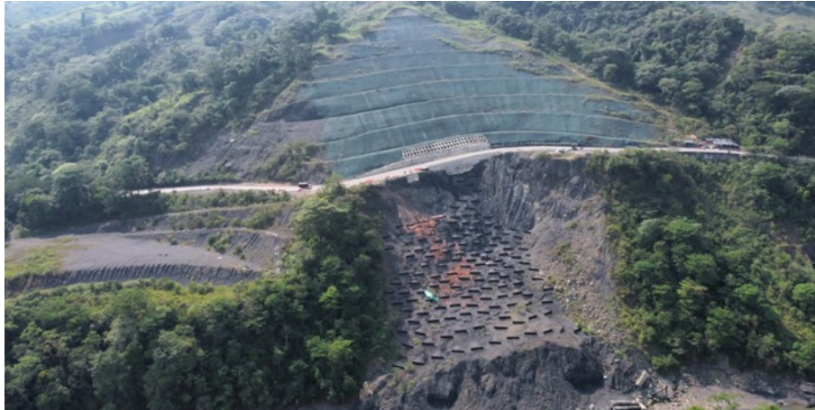
Estado actual PR 87+000 – Sector La Granja.

El Consorcio Vial MHC 056 realizó los estudios y diseños para la repotenciación de los puentes, construcción de carril adicional y obras de mitigación.