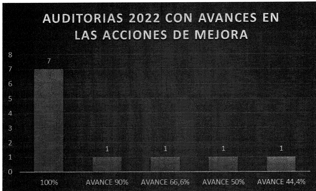
Gráfica No. 02

Se evidencia en la matriz expuesta anteriormente y en la gráfica que de las 13 auditorías realizadas en la vigencia 2022 con acciones de mejora el 92,30% han presentado el plan de mejoramiento.