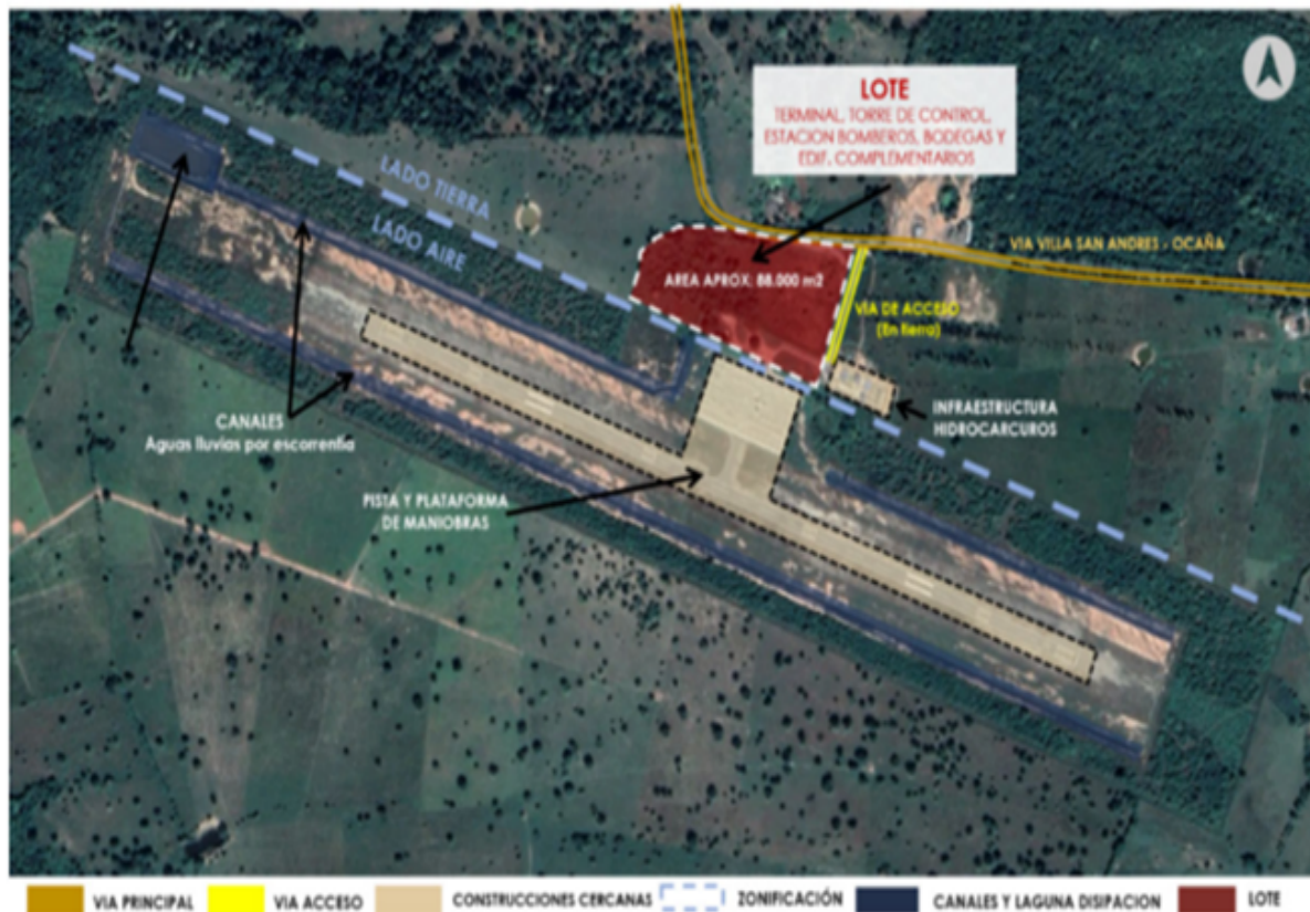
Figura 1 Proyecto realizar la construcción de terminal, base SEI e infraestructura complementaria del aeropuerto Hacaritama de Aguachica, Cesar

A continuación se relaciona el render del proyecto: