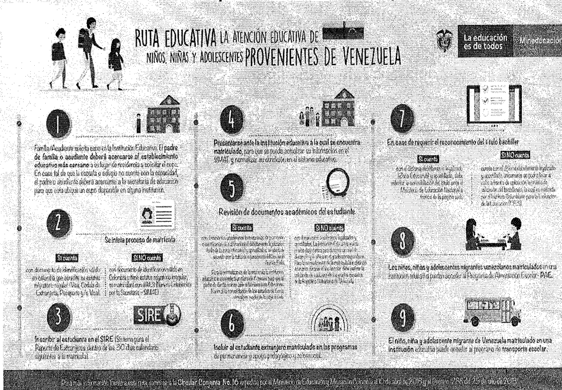
Gráfico 2. Ruta educativa para la atención de NNA provenientes de Venezuela