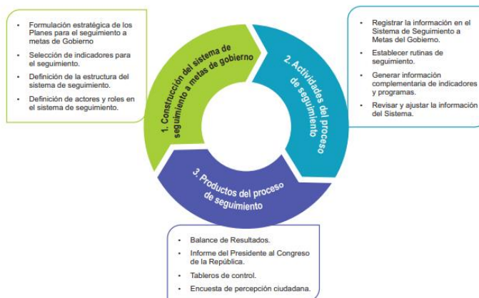
Gráfico No. 1. Principales fases del sistema de seguimiento a metas de gobierno

De acuerdo con lo anterior, y de conformidad con la Guía metodológica de seguimiento a políticas públicas 8 de SINERGIA, existen 3 fases características del sistema de seguimiento, a saber: 1) construcción del sistema de seguimiento a metas de gobierno; 2) actividades del proceso de seguimiento; y 3) productos del proceso de seguimiento. En el siguiente gráfico se describen cada una de ellas: