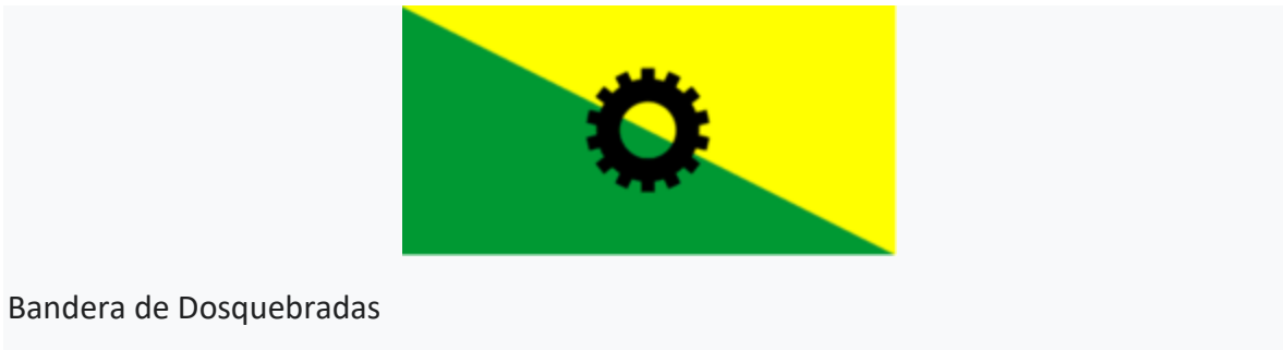
Bandera de Dosquebradas

La bandera fue oficializada por el honorable Concejo Municipal mediante acuerdo n.º 005 de abril de 1983. Presenta 2 colores, amarillo y verde, sesgados con un piñón negro de 14 dientes en el centro: