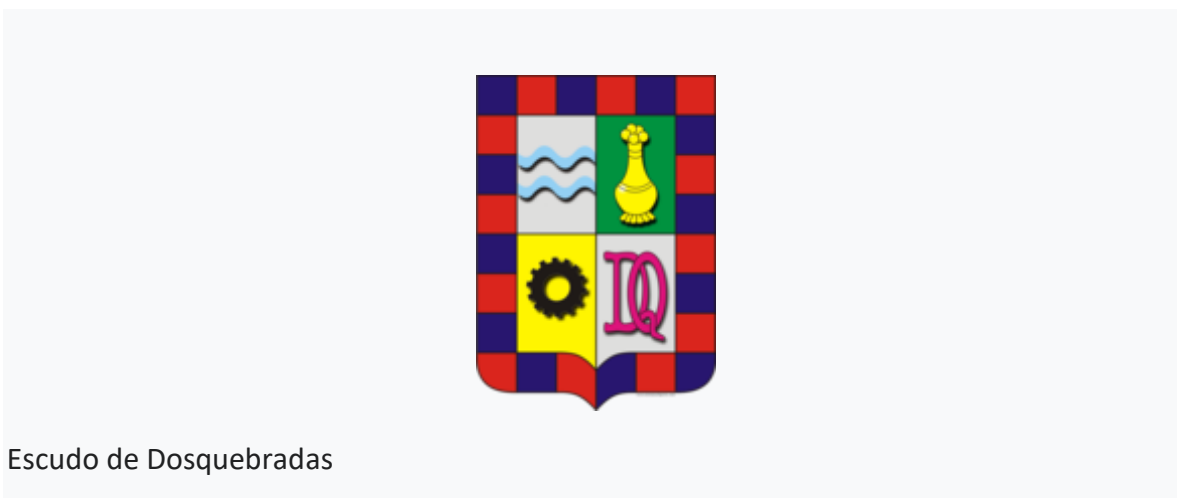
Escudo de Dosquebradas

El escudo de armas se creó mediante Acuerdo 015 del 18 de noviembre de 1985 por el Concejo del Municipio, y está conformado por cuatro secciones o carteles: