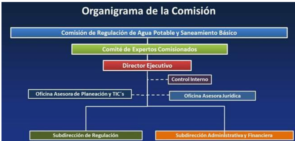
Figura 1. Organigrama de la Comisión.