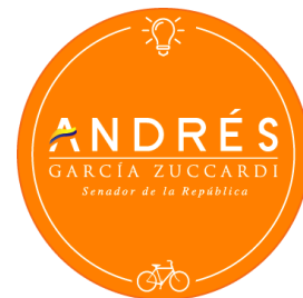
ANDRES GARCIA ZUCCARDI Senador de la República