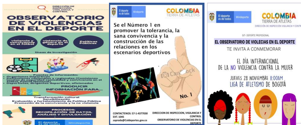
Gráfica 2: Piezas de divulgación de la no violencia en el deporte

5. En cumplimiento de las funciones establecidas al Ministerio del deporte, mediante la promulgación de La Ley 1270 del 2009, que en su artículo 4º asigna al hoy Ministerio del Deporte la Secretaría Técnica de la Comisión y a su vez, mediante el Decreto 1267 de Abril 15 de 2009, se crea de acuerdo a su artículo quinto, un grupo de apoyo técnico para la Comisión Nacional, conformado por un delegado de cada una de las entidades que integran la Comisión Nacional, con el fin de actuar como instancia asesora, permanente de la misma, el ministerio del Deporte en lo corrido del año 2019, ha convocado y participado en once (11) reuniones de la Comisión Técnica Nacional - CTN. Producto de las cuáles se ha constituido la misma cantidad de actas, las cuáles se adjuntan como anexo al presente informe.