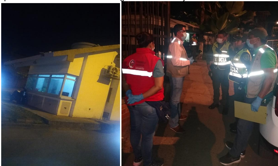
Imagen 2. Estación de policía san Marino, realiza acompañamiento.

Se inicia el recorrido en la comuna 7 solicitando el acompañamiento en estación de policía, luego se continua con recorrido por los diferentes barrios, informando a la gente por medio de megafono, permanecer en su casas y continuar con los protocolos de higienes para evitar el contagio del covid-19. En el recorrido se encuentra un grupo de personas departiendo en la calle, que al acercarse los vehiculos ingresan a la casa y acatan informacion.