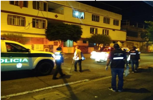
Imagen 4. Adulto mayor en la Calle

Imagen 3. Se realizan dos Comparendos por parte de policia y transito. En el barrio villacolombia, se encuentra a Adulto mayor en la calle, la policia del cuadrante la acompaña hasta su casa, ademas se le informa a la sra de las medidas sanotarias que se deben tomar.