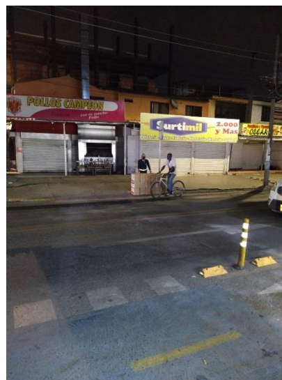
Fotografía 10 fotografía 10 Fecha mayo 7 de 2020, Barrio Floralia Cali.