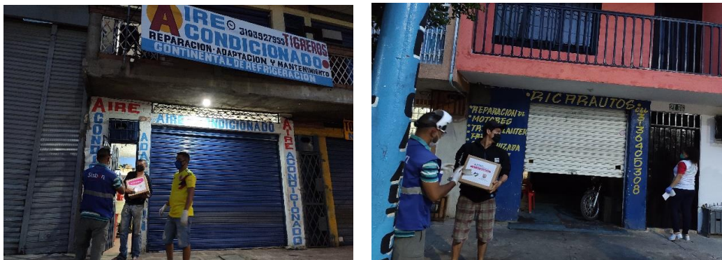
Foto Nº 6 y 7. Evidencia de Entrega de Ayudas Humanitarias en Unidades de Negocio