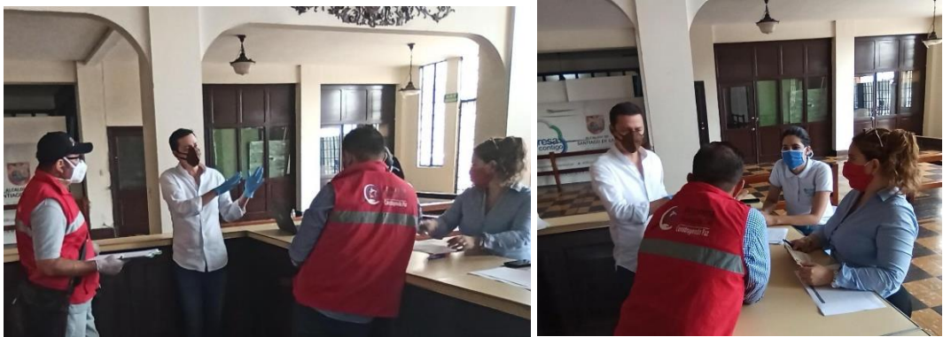
Fotos 3 y 4, Edificio de Coltabaco. Fecha 22/04/ 2020 . Fuente Jaime Corrales, Secretario de Turismo de Santiago de Cali