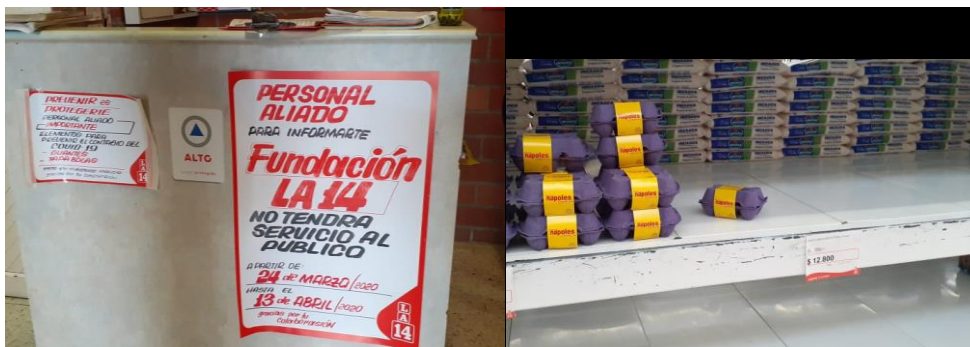
Imagen. No.1. Registro fotográfico de Visita de verificación de precios y cuidados sanitarios en el Supermarket la Nueva Tequendama y almacenes 14 de Pasoancho.