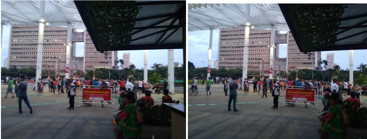
Imagen 1. Plazoleta Jairo Varela (Grupos Indigenas, Venezolanos y Habitantes de Calle).

Por parte de la Secretaria de Seguridad y justicia se acaloro a la comunidad que en el momento se estaba generando la logistica para la entrega de ayudas, por lo que estos grupos se dispersaron.