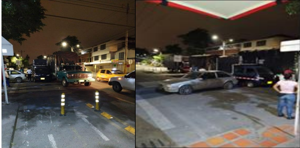
Fotos 1,2,(página anterior) 3,4 Fecha 7 de mayo de 2020, fecha marzo 7 de 2020, Barrio Floralia Cali.