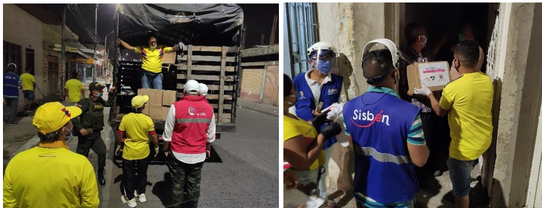
Foto N° 5 y 6. Funcionarios de la Administración Municipal y Policía Nacional en apoyo a la jornada de entrega de ayudas humanitarias