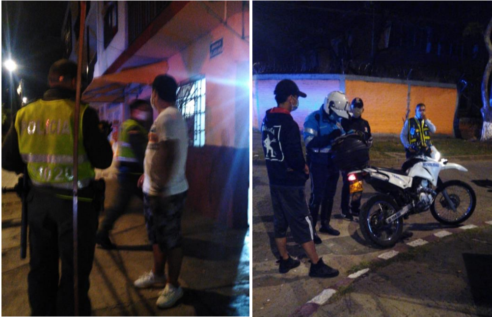
Imagen 3. Se realizan dos Comparendos por parte de policia y transito. En el barrio villacolombia, se encuentra a Adulto mayor en la calle, la policia del cuadrante la acompaña hasta su casa, ademas se le informa a la sra de las medidas sanotarias que se deben tomar.