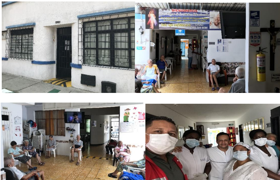
Registro fotográfico de la jornada acompañamiento Personería Distrital de Santiago de Cali – 22 de marzo de 2020

Se anexa a continuación registro fotográfico de la visita a continuación.