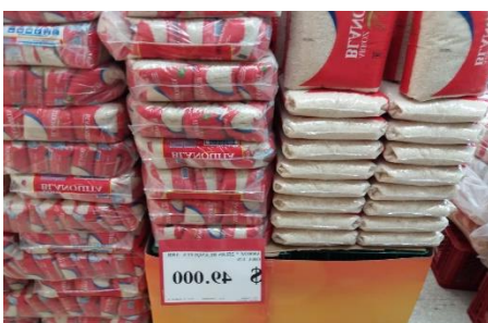
Es arroz blanquita