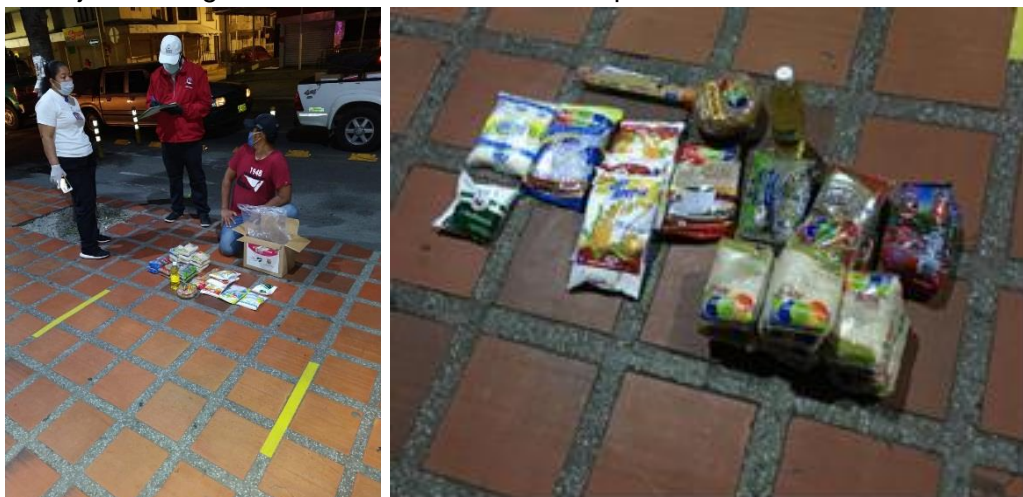
Foto 5 Fuente Diego Jacinto Vergara Medina, foto 6 Fuente Egidio Moreno 7 fecha mayo de 2020, Barrio Floralia Cali.