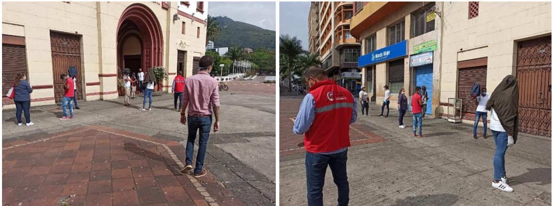
Fotos 1 y 2. Edificio de Coltabaco. Fecha 22/04/ 2020.