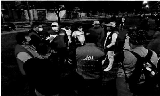
Imagen No. 14 y 15. Recepción de quejas de líderes de comuna 21 sobre inconsistencias en la entrega de ayudas humanitarias y amenazas de los que son objeto