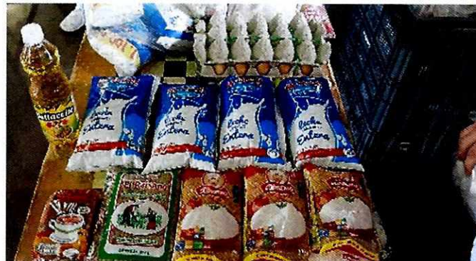
Imagen No. 7: Vista de los productos que componen el paquete escolar segunda entrega