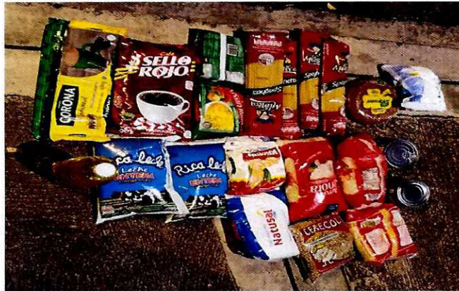
Imagen No. 8: Vista de productos que componen mercados entregados en la Comuna 21

La ayuda humanitaria se compone de la entrega de mercados con productos de primera necesidad que constan de elementos nutricionales variados básicos, los cuales fueron en su mayoría contratados con grandes superficies como La 14 o Éxito.