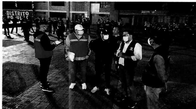
Imagen No. 13: Actividad de entrega de mercados – Comuna 21

Se viene realizado por parte del Órgano de Control Distrital acompañamiento a las actividades de entrega de ayudas humanitarias “Ruta Alimentaria” en las comunas y corregimientos de la ciudad, en las que se verifica el cumplimiento de los protocolos de prevención, la logística de entrega, el respeto a la metodología definida para cada caso y la recepción de quejas ciudadanas.