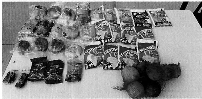
Imagen No. 3: Vista de los productos que componen el paquete escolar – primera entrega