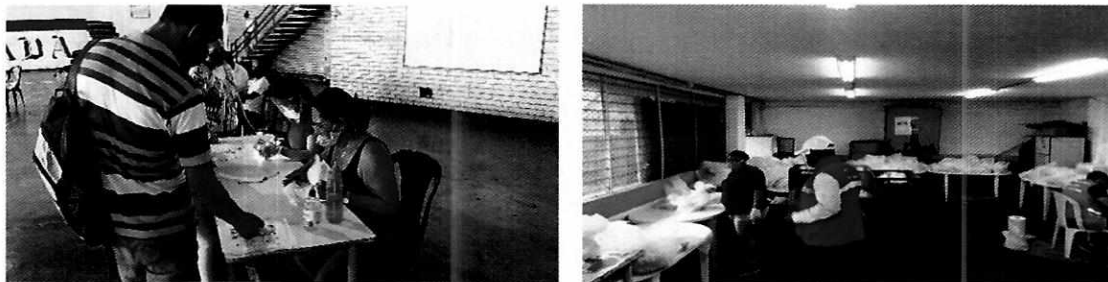
Imagen No. 5 y 6: Visita de verificación I.E. Santa Librada y la I.E. Jesús Villafañe Franco

Para la entrega de los paquetes se estableció por parte de los operadores un protocolo de bioseguridad, a fin de prevenir cualquier contacto ante la emergencia de la pandemia.