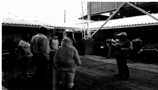
Imagen No. 4: Visita de verificación I.E. Jesús Villafañe Franco