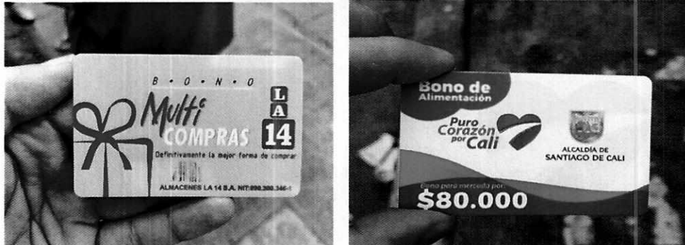
Imagen No. 11 y 12: Vista de los bonos multicompra que componen la ayuda humanitaria entregada

La ayuda humanitaria también comprende bonos multicompra por un valor de $80.000 pesos y pueden ser utilizados en supermercados de la cadena como La 14, Olímpica, Surtifamiliar, Cañaveral, Mercamio, Mercatodo y Justo y Bueno.