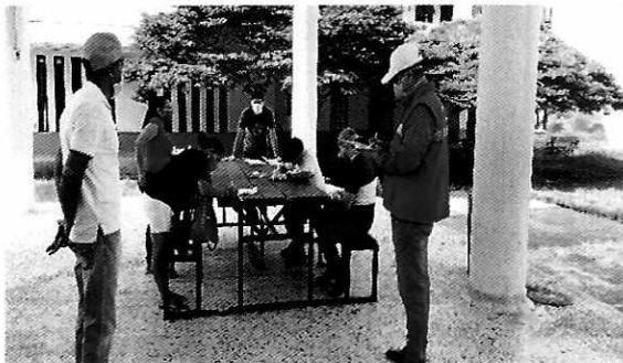
Imagen No. 1 y 2: Visita de verificación a la I.E. Multiproposito y la I.E: José María Carbonell

Para la entrega de los paquetes de alimentación, fue dispuesto un protocolo de bioseguridad, a fin de garantizar la protección y seguridad de las familias y funcionarios. La entrega se realizó desde primeras horas de la mañana. Los padres de familia fueron contactados por funcionarios de las sedes educativas, quienes informaban día y hora de entrega. Durante los primeros días se presentaron algunos inconvenientes con la llegada de las familias y la entrega de los productos, debido a que en la ciudad se había implementado la estrategia de pico y cédula. Se tomaron las acciones respectivas y se facilitó a los padres que pudieran acceder a los establecimientos educativos respectivos.