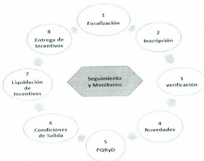
Gráfica. Ciclo Operativo Familias en Acción