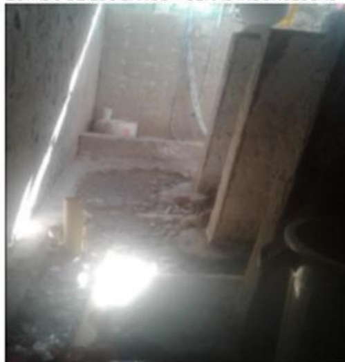
ESTADO DE LOS BAÑOS – OBRAS INCONCLUSAS