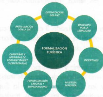
Gráfica No.1 - Programa Formalización Turística