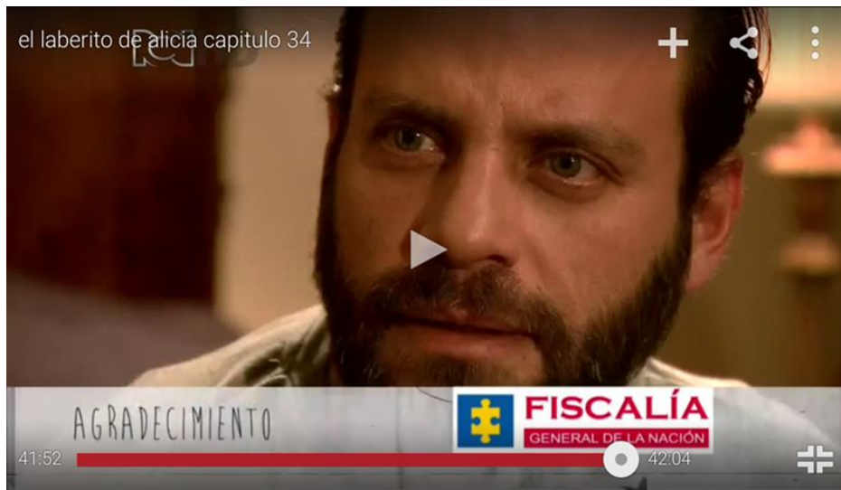
Imagen de un capítulo de “El Laberinto de Alicia”.