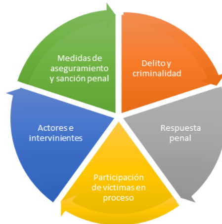
Gráfica No. 1: Dimensiones Batería de Indicadores Observatorio Penal