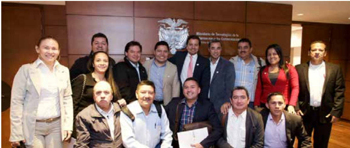
Con los Alcaldes de Caquetá gestionando inversión en el Ministerio de Tecnologías de la Información y las Comunicaciones (MinTIC's).