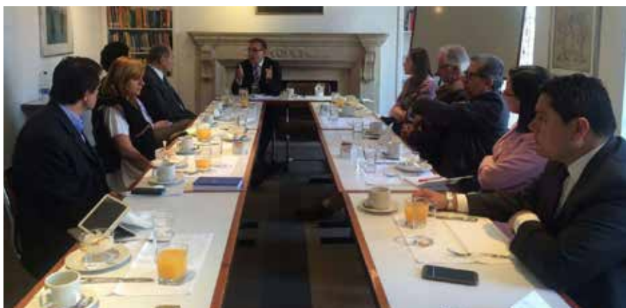
Reunión Copresidentes Comisión de Paz definiendo estrategias para la construcción de caminos para la Paz.