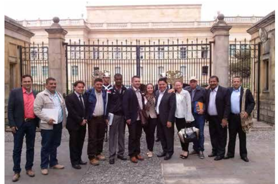
Visita alcaldes de Caquetá a la Presidencia de la República.