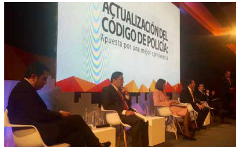
FORO: Actualización Código de Policía y Convivencia : Apuesta por una mejor convivencia.