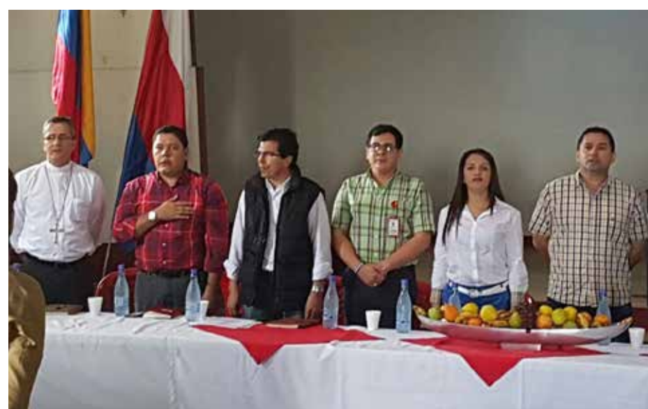
Trabajando en Equipo con el gobernador Álvaro Pacheco, Alcaldesa de El Paujil Liliana Cuellar Floriano, Diputados, Concejales y Sociedad Civil Mesa Departamental por Defensa del Agua y Territorio.