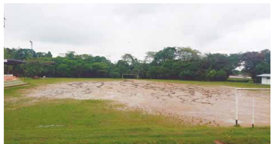
Cancha de fútbol Los Molinos en Florencia. Aquí se construirá la cancha sintética