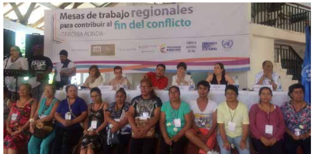
En Caquetá trajimos la Comisión de Paz y la Mesa Regional para terminar el conflicto armado.