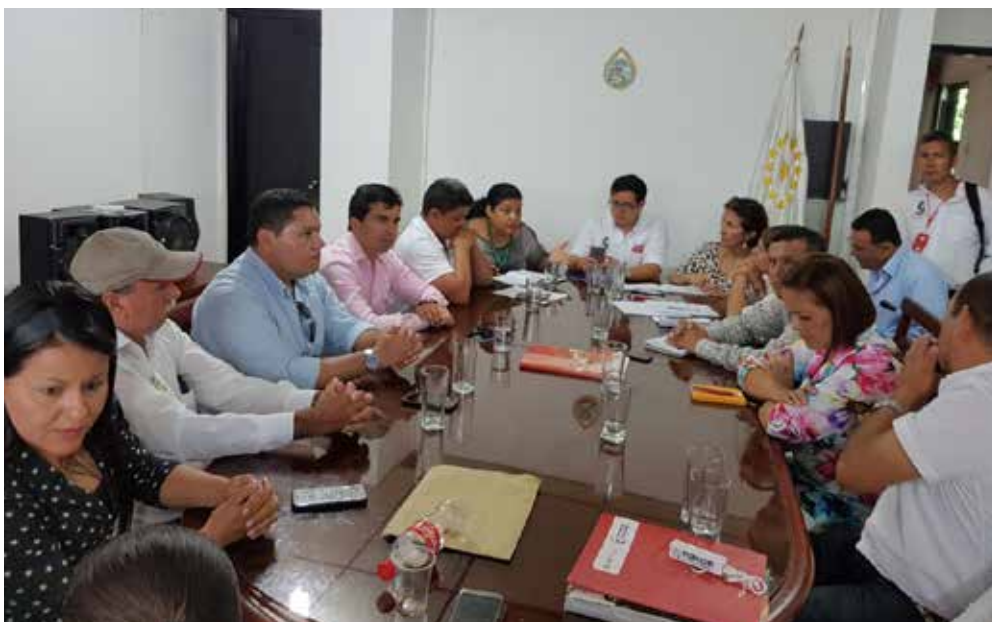
Reunión entre autoridades locales, Orlando Velandia, director de la Agencia Nacional de Hidrocarburos-ANH y el representante a la Cámara, Harry González, creando canales para el diálogo con el Gobierno Nacional para discutir el impacto que está causando el ingreso de petroleras al Caquetá.

E n la Ley del Plan Nacional de Desarrollo incluí que el Caquetá pertenece a la AMAZONIA Colombiana. Nuestro modelo de desarrollo debe proteger los Recursos Naturales, la Biodiversidad, la Flora, la Fauna y especialmente nuestra Agua.