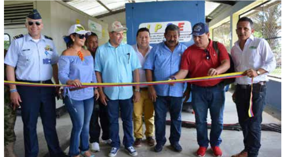
Inaugurando el servicio de energía las 24 horas en el Municipio de Solano en apoyo a la gestión del gobernador Álvaro Pacheco Álvarez y Alcalde Alejandro Quintero.