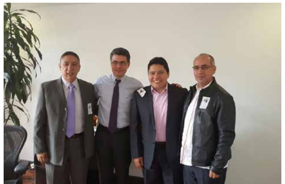
Discutiendo problemática del sistema de salud en Caquetá.