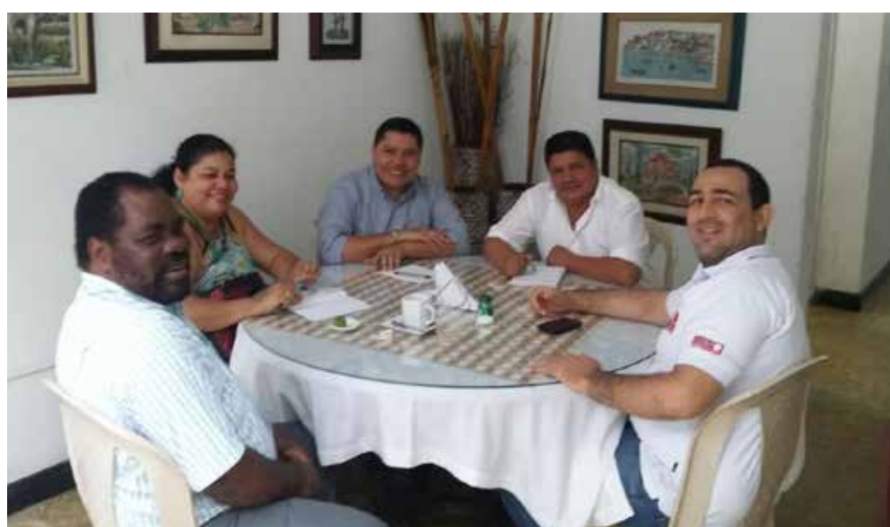
Discutiendo la problemática del ingreso de petroleras con miembros de la Mesa Departamental por la defensa del Agua y el Territorio.