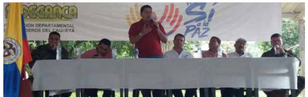
Foro adelantado en el municipio de San Vicente del Caguán, coordinado por Fedeganca y la Oficina del Alto Comisionado para la Paz. Compartiendo mi opinión sobre el proceso que se viene desarrollando en la Habana -Cuba.