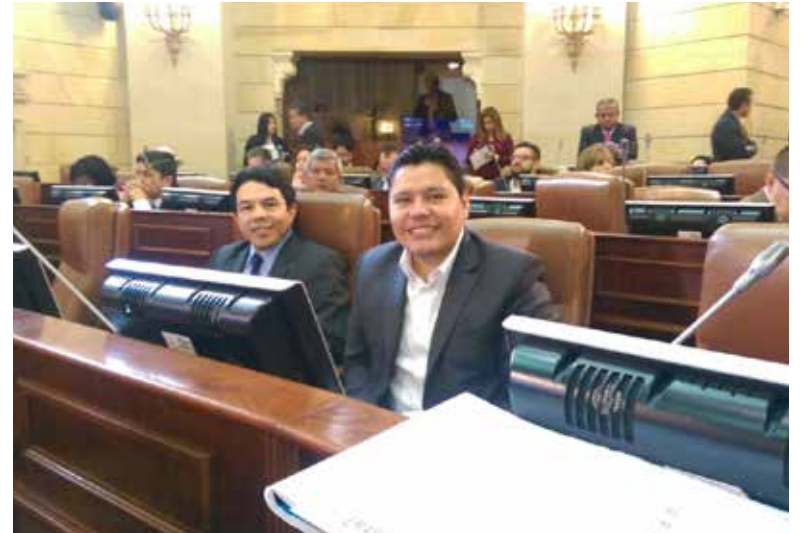
Congresistas Oscar Hurtado y Harry González en Plenaria de la Cámara de Representantes.