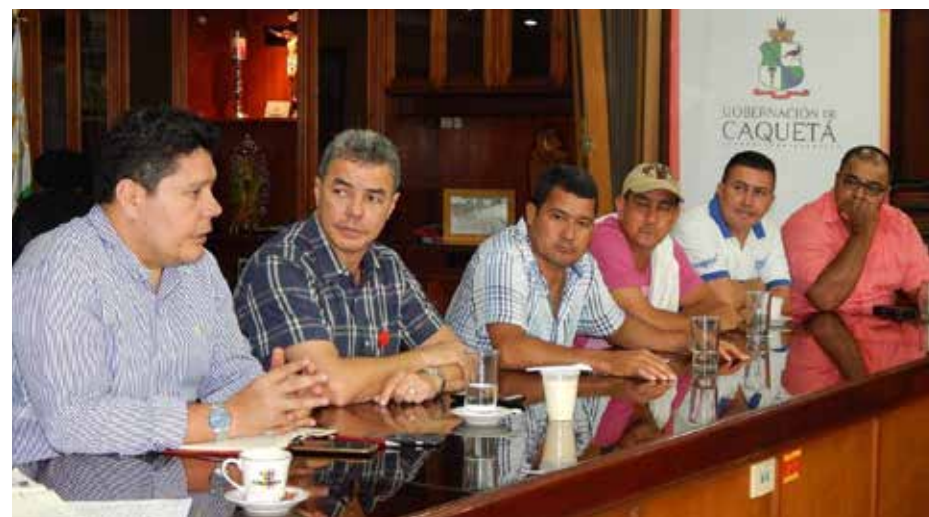
Acompañé al gobernador de Caquetá escuchando las preocupaciones de los campesinos de El Doncello por el ingreso de petroleras.