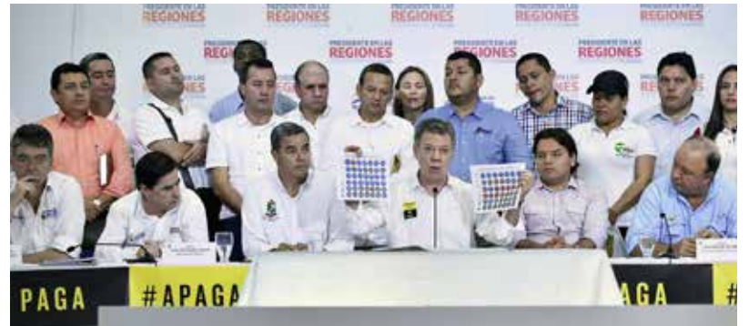
Presidente Juan Manuel Santos con el Consejo de Ministros en Caquetá.