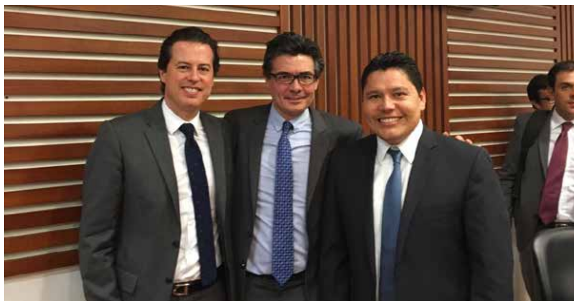
En compañía del Senador Juan Manuel Galán, autor de la ley y del Ministro de Salud, Alejandro Gaviria.

LEY 1787 DEL 6 DE JULIO DE 2016 "Por medio del cual se reglamenta el acto legislativo 02 de 2009".