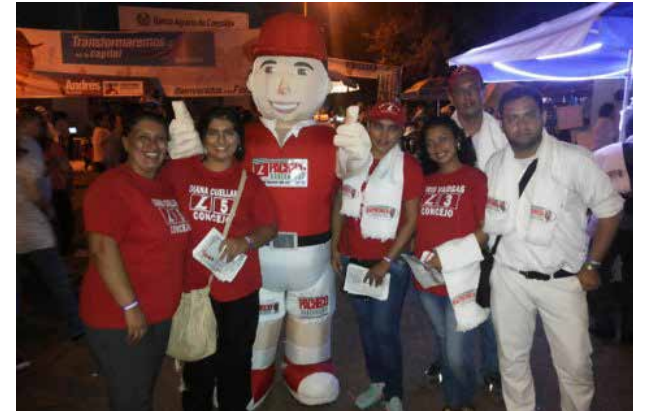
Harrysiño en campaña Pacheco Gobernador!.