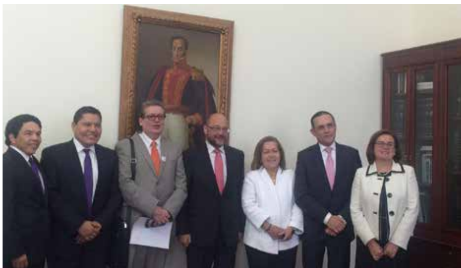
Con el Presidente del Parlamento Europeo Martin Schulz. Pidiendo apoyo al posconflicto en Caquetá.