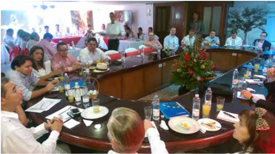
Visita de los Embajadores de la Unión Europea a Florencia - Caquetá cumpliendo agenda programática en beneficio de todos los caqueteños. Acompañados de nuestro Gobernador Álvaro Pacheco Álvarez, Senador Guillermo García Realpe y Alcalde Andrés Mauricio Perdomo.