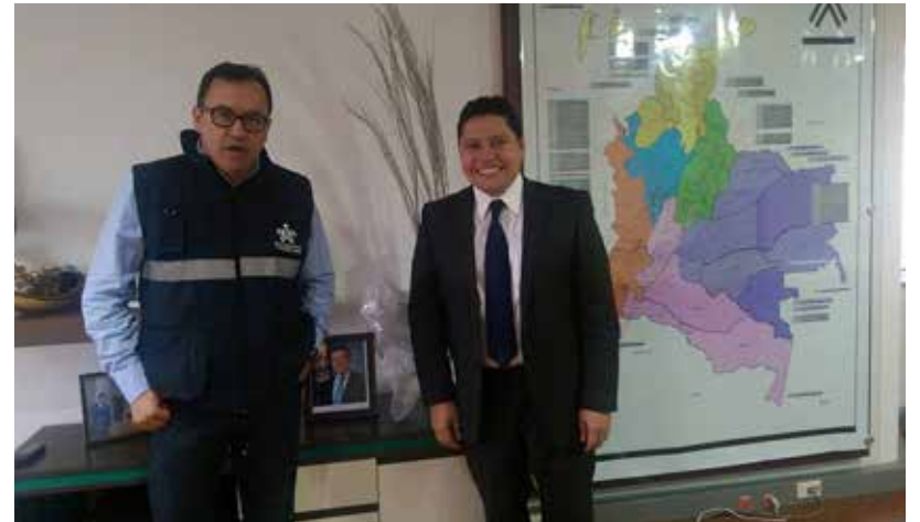
Director General del Sena Alfonso Prada, gestionando recursos para construcción sedes del Sena Florencia y San Vicente del Caguán.