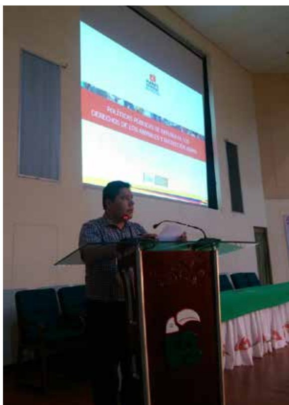
Foro animalista. Nueva legislación de protección a los animales realizado en la Universidad de la Amazonía.