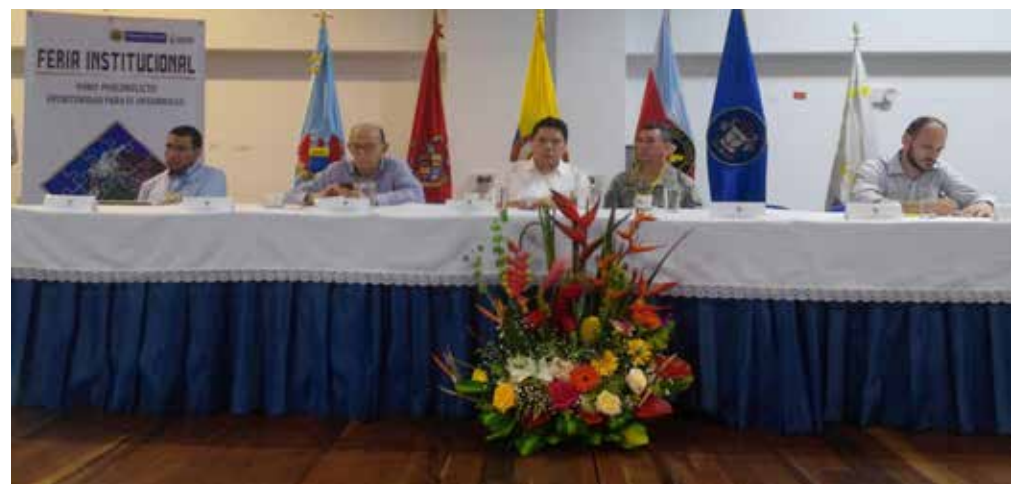
FORO POSCONFLICTO : Oportunidad para el Desarrollo. Se adelantaron 5 mesas de trabajo con los siguientes ejes temáticos: Sociedad civil y relaciones cívico militares; salud y seguridad; víctimas y minas; narcotráfico y desarrollo agrícola, y posconflicto: impacto social y económico.