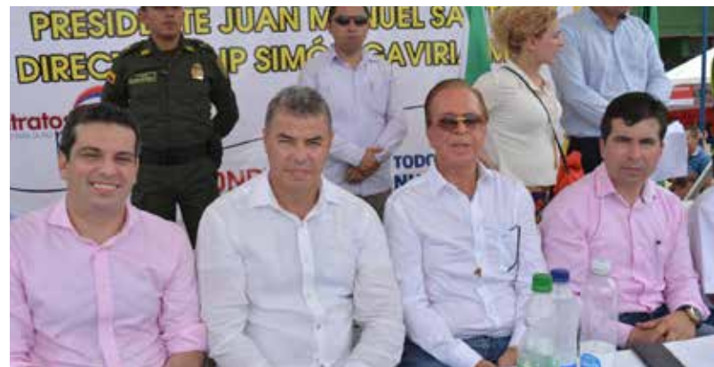
Cumplíndole al Caquetá con la firma del Contrato Plan para la Paz con la presencia de Simón Gaviria y diferentes autoridades del orden nacional.